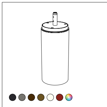
Cassaforma PVC. (Ø80mm H.200mm)